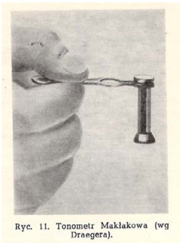
Ryc. 11. Tonometr Maklakowa (wg Draegera).