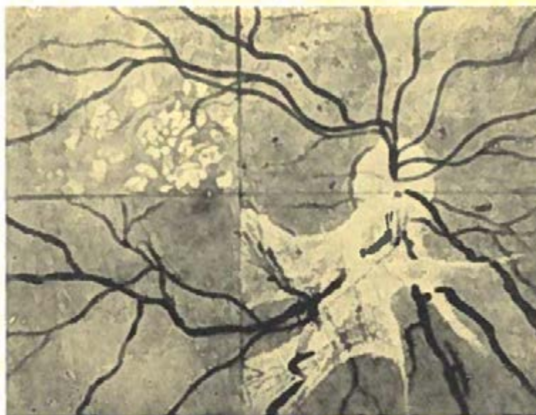
Ryc. 1. Schemat dna oka w cukrzycy. Górny prawy prostokąt: mikroaneuryzmaty; górny lewy prostokąt: żółtawobiaławe ogniska; dolny lewy prostokąt: rozstrzenie żyłne; dolny prawy prostokąt: nowotworstwo tkanki łącznej i naczyń (wg Goodmana).

„Na pierwszy rzut oka zadawałoby się, że każda operacja oczna może być wykonywana ambulatoryjnie. Przytłaczająca większość zabiegów ocznych dokonywuje się w znieczuleniu miejscowym, przy użyciu tak małych środków narkotycznych, że ich ogólne działanie jest nieznaczne. Zabiegi są krótkotrwałe i na ogół mało bolesne, operacje na samej gałce może nawet mniej bolesne niż inne. Cięcia przy zabiegach są tak małe, że nie grożą poważnie większym krwotokiem”. [16] Opis ten mógłby śmiało pochodzić z XXI wieku. Jednak już szczegółowe omówienie wskazań i przeciwwskazań do zabiegów ambulatoryjnych różni się zasadniczo od praktyki współczesnej. Do bezwzględnych przeciwwskazań zaliczył zabiegi wymagające narkozy oraz zabiegi, po których „chorych bezwzględnie powinien pozostawać w łóż-