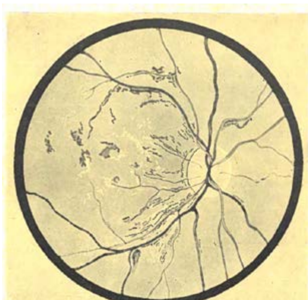
Ryc. 6. Retinopatia cukrzycowa.