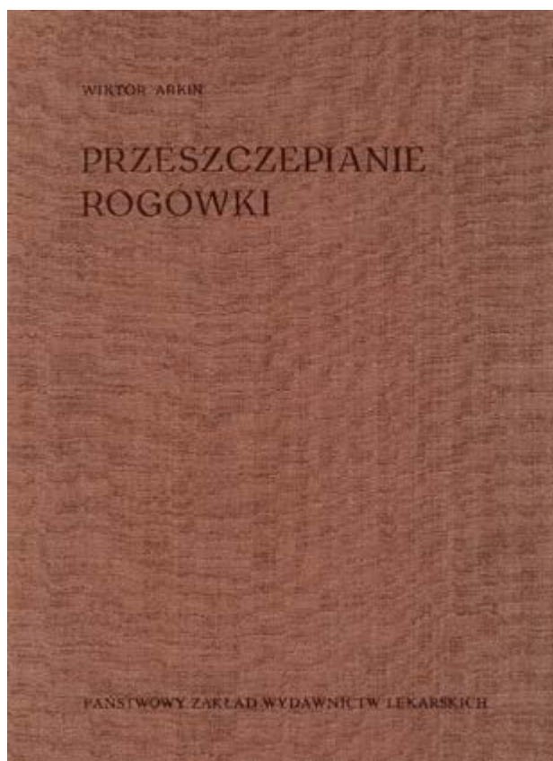
Ryc. 7. Strona tytułowa.

ku, a więc operację zaćmy, daleko posuniętej jaskry, odklejonej siatkówki”. Do względnych przeciwwskazań zaliczył autor m.in. względy społeczne, czyli kiepskie warunki higieniczne w domu, brak opieki w domu, etc. Do zabiegów wykonywanych ambulatoryjnie Arkin zaliczył zabiegi dotyczące powiek i spojówki, ale co ciekawe także niektóre zabiegi oczodołowe, usunięcie gałki ocznej oraz operacje zeza. Autor podał, że ówczesnie w Ambulatorium Kasy Chorych w Warszawie wykonywano ok. 500 operacji ambulatoryjnych. W pracy pt. O zaletach i wadach niektórych sposobów operowania zaćmy z 1935 roku Arkin przedstawił zalety i wady operacji zewnątrztorbkowej i wewnątrztorbkowej zaćmy oraz omówił różne techniki dotyczące tej drugiej metody. [17] W pracy pt. O powstaniu i roli przedarc w odwarstwieniu siatkówki z 1948 roku omówił rolę przedarc w etiopatogenezie odwarstwienia siatkówki oraz znaczenie ich zaopatrzenia dla skuteczności operacji. [18]