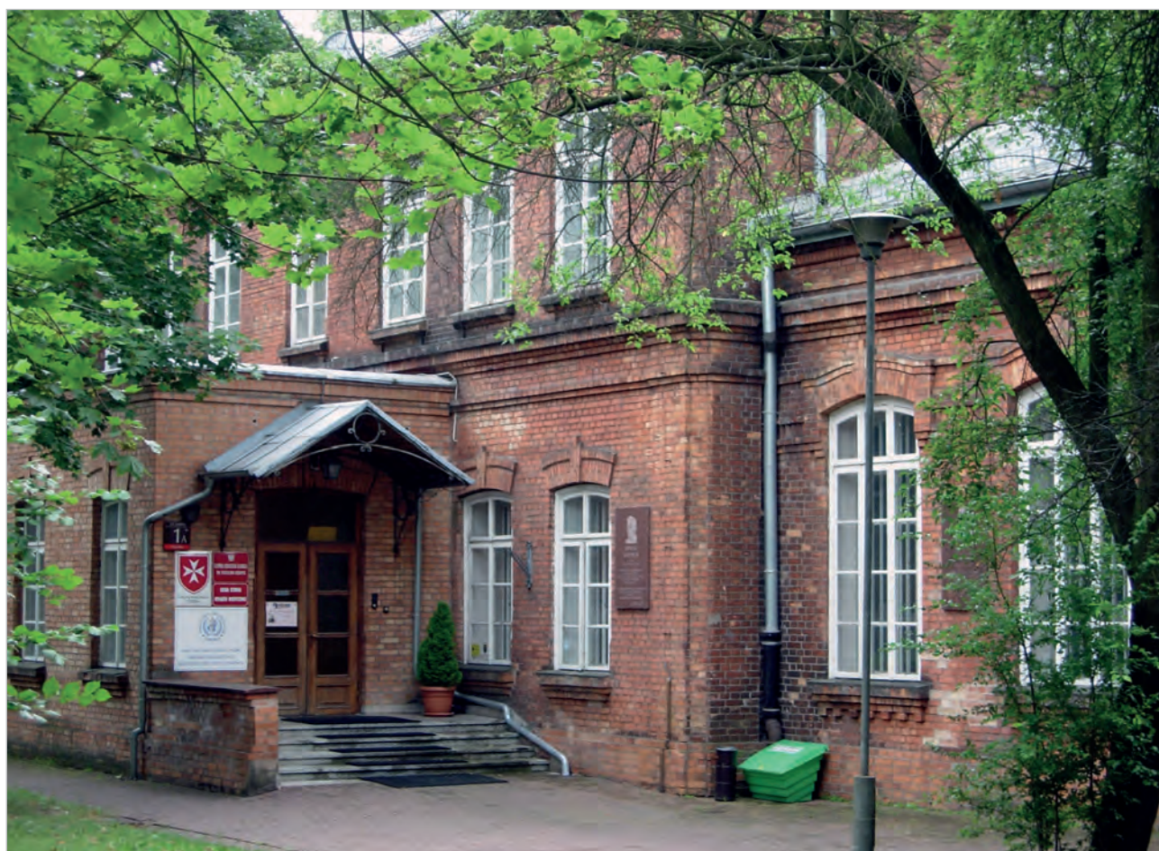
Ryc. 5. Wejście do budynku Działu Starej Książki Medycznej GBL, Warszawa, 2016.