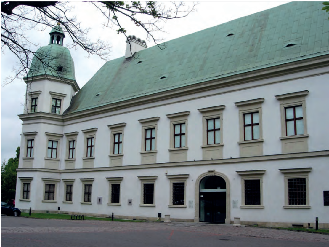
Ryc. 7. Zamek Ujazdowski, była siedziba Szkoły Podchorążych Sanitarnych, Warszawa, 2016.