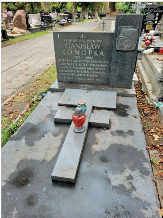
Ryc. 3. Nagrobek S. Konopki na Cmentarzu Wojskowym na Powązkach w Warszawie, 2024.