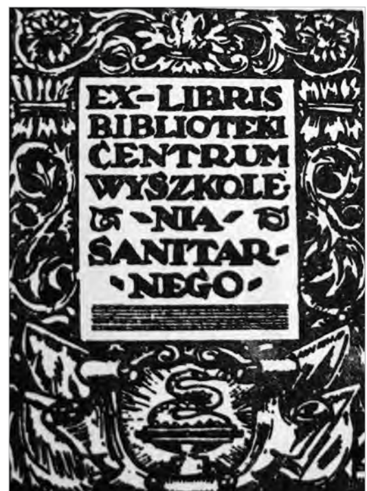
Ryc. 4. Exlibris Biblioteki Centrum Wyszolenia Sanitarnego w Warszawie, lata 30. XX w..