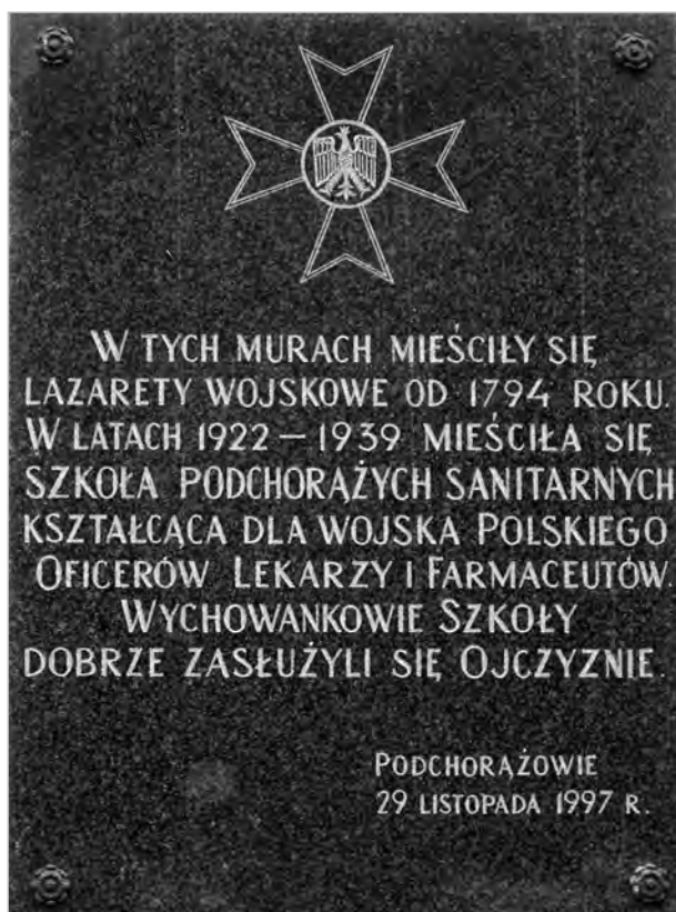
Ryc. 6. Tablica upamiętniająca Szkołę Podchorążych Sanitarnych umieszczona na terenie byłej „Rzeczypospolitej Ujazdowskiej”, Warszawa, 2016 (fot. K. Kopociński).