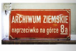
10 Tablica umieszczona na kamienicy przy ul. L. Waryńskiego 8 (wcześniej i obecnie ul. św. Gertrudy) utrwajająca znalezienie wejścia do Archiwum w zieleni Plant

łączeniu kwerend z udostępnianiem oraz omówienie działalności naukowej po udostępnianiu. Podkreślić należy, że Kamila Follprecht przeanalizowała działalność Archiwum (czy raczej Archiwów) na różnych polach zarówno w ujęciu historycznym, jak i współczesnym. Wywód w pierwszym rozdziale został podparty może niekiedy zbyt długimi, ale za to niezwykle trafnymi, interesującymi i wzbogacającymi tekst autorki cytatami.