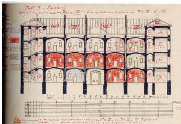
11 Plan adaptacji na potrzeby Krajowego Archiwum Aktów Grodzkich i Ziemskich w Krakowie pomieszczeń gmachu ozdrowieńców (rekonwalescentów) na wzgórzu wawelskim, sporządzony przez Stanisława Smolkę, 1911 r.

Podrozdział drugi to niezwykle wnikliwe studium dziejów gmachów archiwalnych w Krakowie. Autorka przeanalizowała bardzo trudną sytuację lokalową krakowskich Archiwów od momentu ich powstania aż do oddania do