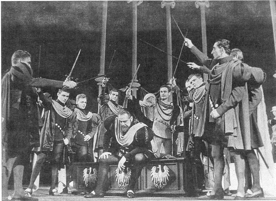
6. Odprawa posłów greckich J. Kochanowski, scena zbiorowa.

A. Fredro Śluby panieńskie , reżyseria: R. Niewiarowicz, scenografia: J. Jeleński, premiera: 22.XII.1963, ilość przedstawień: 33.