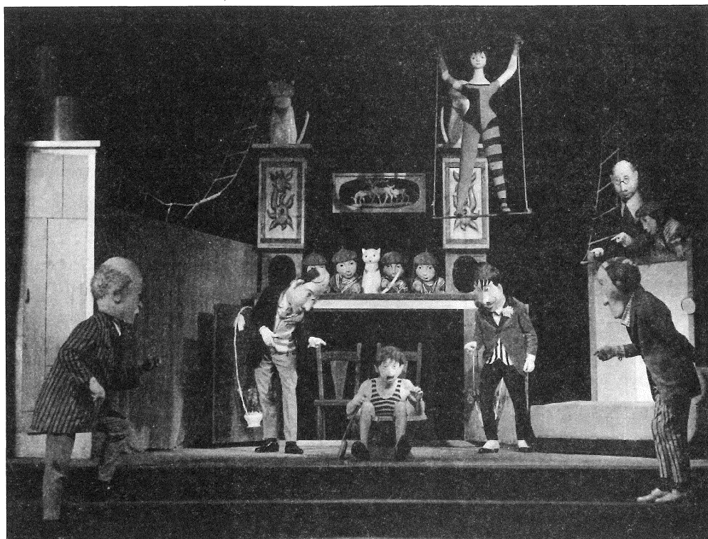
Teatr Groteska, 1959 r. „Męczeństwo Piotra Ohey'a” S. Mrożek, scena zbiorowa