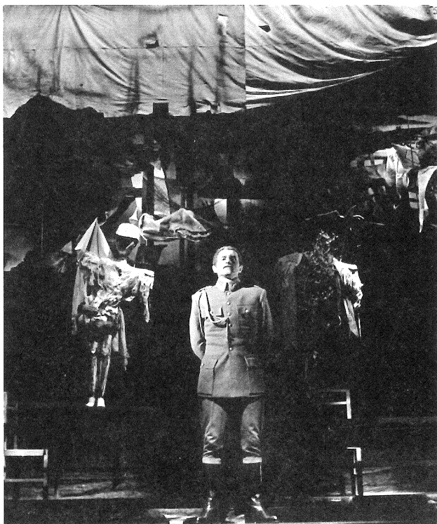
Teatr Ludowy, 1960 r. „Radość z odzyskanego śmietnika” w/g J. Kadena -Bandrowskiego, Franciszek Pieczka – Generał Barcz