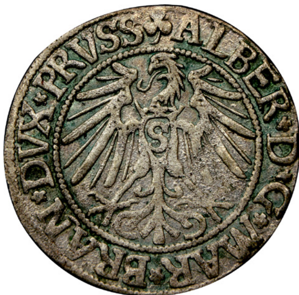
Wzór orła Albrechta Hohenzollerna z koroną na szyi i cyfrą królewską 5 ( Sigismundus) na piersi na jego groszu