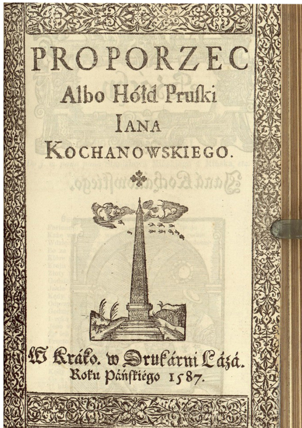
Strona tytułowa dzieła Jana Kochanowskiego Proporzec albo Hołd pruski

nasuwa się choćby przez porównanie, jak bogatą oprawę dokumentacyjną i literacką, zwłaszcza w postaci humanistycznej poezji, a nawet w ikonografii i kartografii otrzymały takie wydarzenia, jak zwycięstwo nad Moskwą pod Orszą w 1514 roku, zjazd wiedeński w 1515 roku i zawarte tam traktaty matrymonialno-sukcesyjne między Habsburgami a Jagiellonami oraz małżeństwo króla Zygmunta I z Boną Sforzą w 1518 roku 2 . A przecież zakończenie ostatniej wojny Polski z zakonem krzyżackim, sekularyzacja zakonu i przekształcenie jego państwa w Prusach w lenno Królestwa Polskiego oraz sam akt hołdu były nie