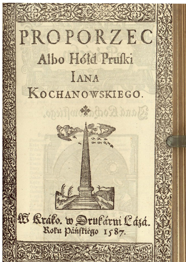
Strona tytułowa dzieła Jana Kochanowskiego Proporzec albo Hołd pruski

nasuwa się choćby przez porównanie, jak bogatą oprawę dokumentacyjną i literacką, zwłaszcza w postaci humanistycznej poezji, a nawet w ikonografii i kartografii otrzymały takie wydarzenia, jak zwycięstwo nad Moskwą pod Orszą w 1514 roku, zjazd wiedeński w 1515 roku i zwarte tam traktaty matrymonialno-sukcesyjne między Habsburgami a Jagiellonami oraz małżeństwo króla Zygmunta I z Boną Sforzą w 1518 roku 2 . A przecież zakończenie ostatniej wojny Polski z zakonem krzyżackim, sekularyzacja zakonu i przekształcenie jego państwa w Prusach w lenno Królestwa Polskiego oraz sam akt hołdu były nie