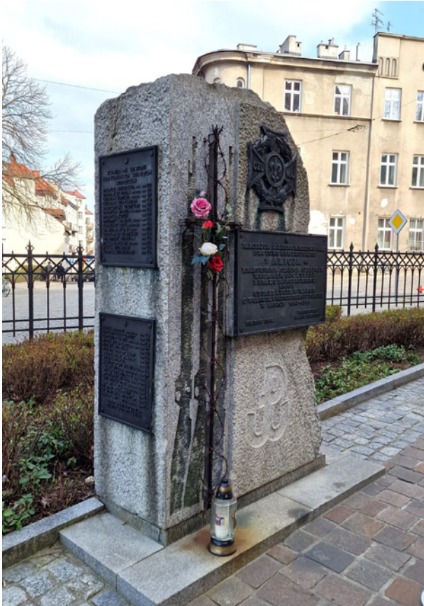
Pomnik młodych żołnierzy plutonu Szarych Szeregów „Alicja”, odsłonięty w 1998 r. przy kościele św. Józefa w Podgórzu, fot. Tomasz Stachów, 2025