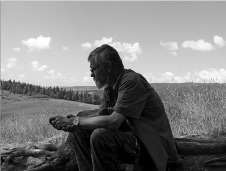
Na wakacjach w Rabce-Zdroju, sierpień 2008 r.