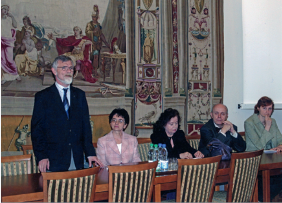
Spotkanie z okazji wydania 1. numeru „LingVariów”, 10 maja 2006 r.