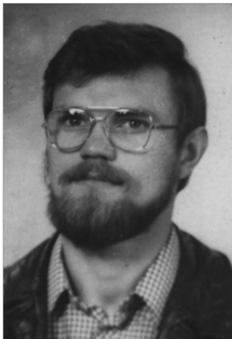
Przed obroną pracy magisterskiej, maj 1977 r.