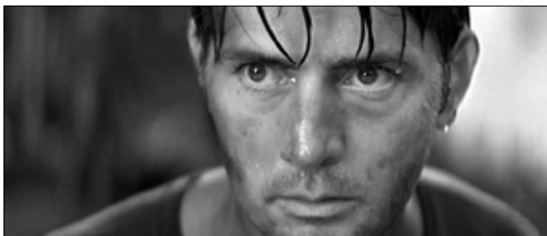
5. Martin Sheen jako Benjamin Willard w Czasie Apokalipsy F.F. Coppoli (1979).