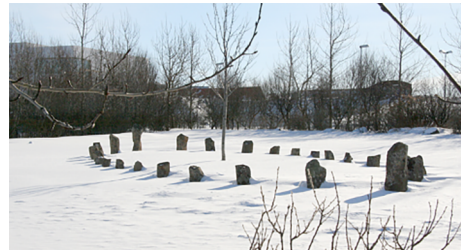
Fot. 1. Część cmentarza Gufunes zarezerwowana dla pogańskich pochówków