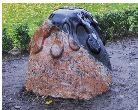
Fot. 2. Neoruniczny kamień w Odense

Forn Siðr wznosił ten kamień na chwałę mężczyzn i kobiet którzy ponownie przędą nić Potężnych Sił pradawnej wiary.