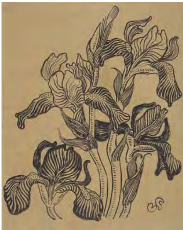
11. Irysy . Motyw typograficzny dla czasopisma „Życie”, 1897; tusz, papier; 20,2 × 16,2 cm (w świetle passe-partout); z kolekcji dr. hab. Józefa Grabskiego.

Śmiałym”, w którym poddał sztukę Wyspiańskiego analizie historycznej 43 .