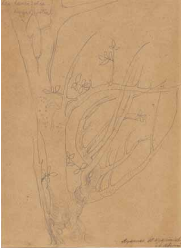
2. Stare drzewo , ok. 1895; ołówek, papier; 20,7 × 15,2 cm (w świetle passe-partout); z kolekcji dr. hab. Józefa Grabskiego.