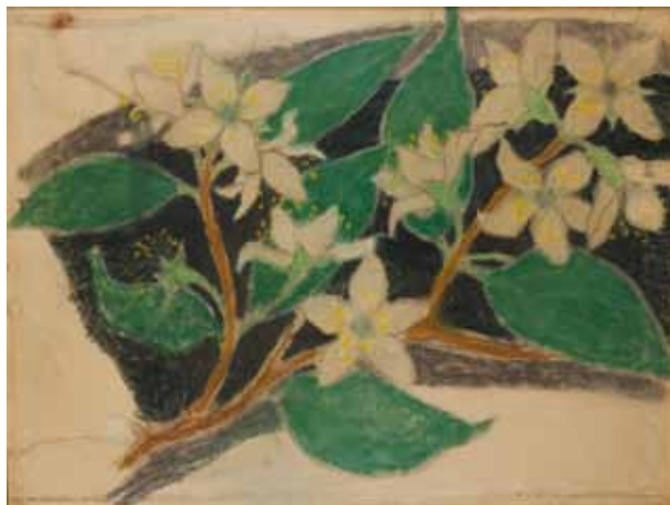
5. Kwiaty śliwy. Projekt dekoracji malarskiej do fary w Bieczu, 1896; pastel, papier; 72,5×95,5 cm; Muzeum Narodowe w Krakowie, nr inw. MNK III-r.a-10746.

i serduszek 17 , szkic ołówkiem postaci przy filarze, nad którym naszkicowany został fragment dekoracji z motywem kwiatów mlecza zamkniętych w łuku 18 oraz rysunek liści i kwiatów mlecza 19 . W zbiorach MNK znajdują się duże kompozycje o podobnym układzie roślin, służące jako wzór do przenoszenia na ściany kościoła bieckiego: kwiaty śliwy 20 (il. 5) oraz kwiaty