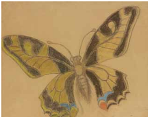
10. Motyl (paź królowej) , 1896; pastel, papier; 37,0 × 43,5 cm; Muzeum Narodowe w Krakowie, nr inw. MNK III-r.a-207.

Drugi motyw typograficzny dla „Życia” – kosaćce – po raz pierwszy był publikowany w tygodniku w grudniu 1897 roku; użyto go jeszcze kilkanaście razy (w tym w wersji potrójnej) do listopada roku 1899, a potem dwukrotnie w Poezjach Lucjana Rydla 41 (il. 11). Także tu wydaje się, że pierwowzorem były projekty dekoracji do kościoła Franciszkanów. Podobny motyw kwiatowy znajduje się na kompozycji Caritas w prezbiterium świątyni.