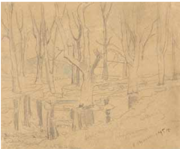
3. Drzewa pośród wody , 1895; ołówek, kredka, papier; 19,0 × 23,5 cm (w świetle passe-partout); z kolekcji dr. hab. Józefa Grabskiego.

go nad obrazami do prezbiterium krakowskiego kościoła Franciszkanów, które to obrazy miały przedstawiać „ogród zupełnej szczęśliwości, gdzie jest lubo, tak miło, tak spokojnie jak nigdy na ziemi być nie może i nie było... las zwątpienia, walki, trudów, przeciwności, przeszkód, gdzie pobyt jest straszny, prze-