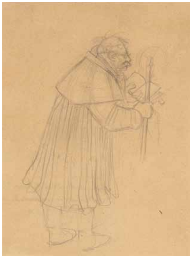
12. Przewodnik z Legendy św. Bolesława Śmiałego . Szkic kostiumu postaci do dramatu „Bolesław Śmiały” Stanisława Wyspiańskiego, 1903–1904; ołówek, papier; 19,7×14,7 cm (w świetle passe-partout); z kolekcji dr. hab. Józefa Grabskiego.