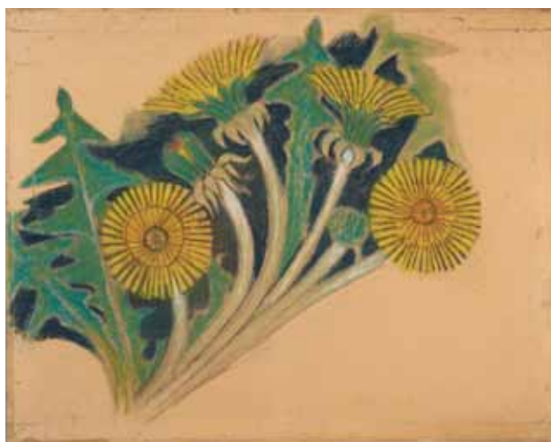
6. Kwiaty mlecza. Projekt dekoracji malarskiej do fary w Bieczu, 1896; pastel, papier; 79,5×105,0 cm; Muzeum Narodowe w Krakowie, nr inw. MNK III-r.a-10747.