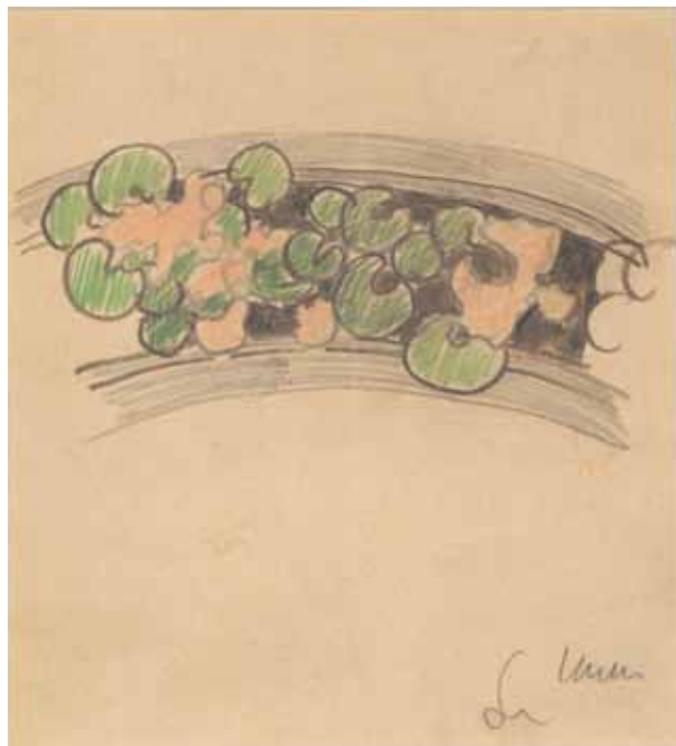
4. Fryz z kaczkowanych krakowiaków. Szkic do dekoracji malarskiej kościoła farnego w Bieczu, 1895; ołówek, kredka, papier; 16,7×15,3 cm (w świetle passe-partout); z kolekcji dr. hab. Józefa Grabskiego.

i serduszek 17 , szkic ołówkiem postaci przy filarze, nad którym naszkicowany został fragment dekoracji z motywem kwiatów mlecza zamkniętych w łuku 18 oraz rysunek liści i kwiatów mlecza 19 . W zbiorach MNK znajdują się duże kompozycje o podobnym układzie roślin, służące jako wzór do przenoszenia na ściany kościoła bieckiego: kwiaty śliwy 20 (il. 5) oraz kwiaty