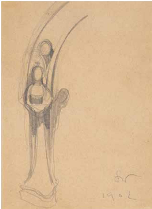
7. Postaci kobiet na tle filaru. Projekt odrzwi lub dekoracji malarskiej do nieokreślonego kościoła, 1902; ołówek, papier; 20,2 × 14,2 cm (w świetle passe-partout); z kolekcji dr. hab. Józefa Grabskiego.

później – na rok 1902 – rysunek z przedstawieniem postaci kobiecych wychylających się zza filaru 23 (il. 7). Wydaje się, że to pogłębione rozwiązanie pomysłu Wyspiańskiego na dekorację malarską kościoła w Bieczu, o czym pisał w liście do Lucjana Rydla w roku 1896: „Oto że nie tylko projekt biecki się skryształizował coraz odrębniej, coraz silniej, coraz konsekwentniej, [...] zostawiłem fryzy nadarkadowe i malw ogrodny, [...] obecnie dodam jeszcze w pewnej górnej wysokości słupów owe duchy okalające kolumny, duchy smutku i duchy wesela jak sobie ręce podają i palce płaczą wokół pnia kamiennego tańcząc unoszone w powietrzu oddechem modlących” 24 . Praca z tej serii znajduje się również w zbiorach Muzeum Narodowego w Warszawie, zatytułowana Duchy smutku 25 .