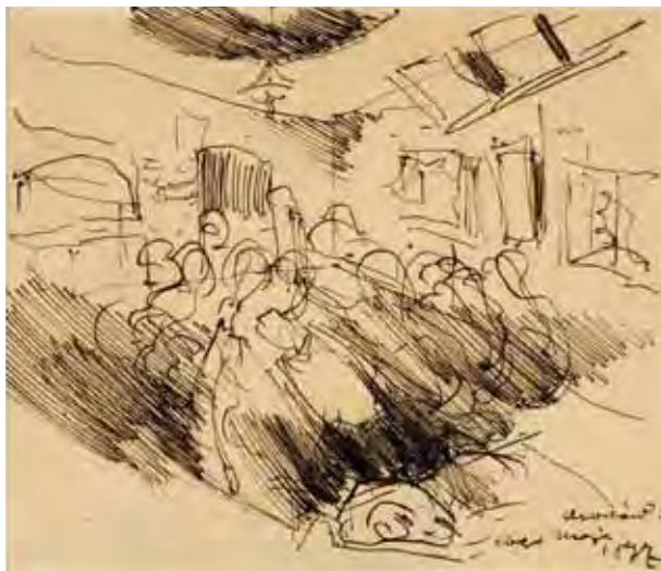
8. Zwiedzający wystawę TAP Sztuka w Sukiennicach, 1897; tusz, papier; 16,0 × 19,0 cm (w świetle passe-partout); z kolekcji dr. hab. Józefa Grabskiego.

Zapisem wspomnienia jest kompozycja z roku 1897 opisana przez Stanisława Świerza jako „Wnętrze teatru, szkic widowni wypełnionej publicznością” 26 , rozpoznanie to podtrzymał Kazimierz Nowacki w swym katalogu plastyki teatralnej, podpisując pracę jako zaginioną 27 (il. 8). Wydaje się, że rysunek przedstawia jednak zupełnie inną sytuację: tłum postaci odwiedzających pierwszą wystawę obrazów i rzeźb Towarzystwa Artystów Polskich „Sztuka” w Sukiennicach. Świadczy o tym zarówno samo naszkicowane wnętrze z wyraźnie zaznaczonymi rzędami obrazów, jak i data powstania: 26 maja 1897 roku. W czasie tym Wyspiański zdawał