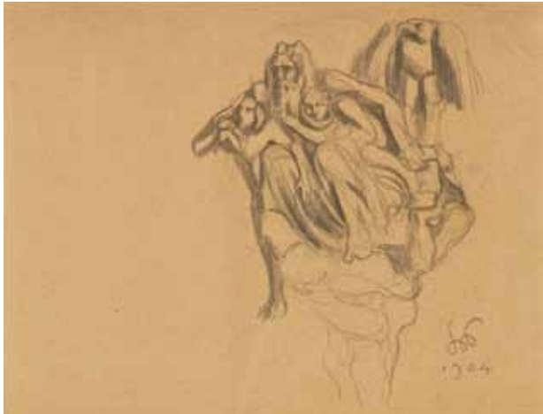
16. Atlas. Szkic do witraża [?] do Domu Towarzystwa Lekarskiego w Krakowie , 1904; ołówek, papier; 17,1 × 21,2 cm; Muzeum Narodowe w Krakowie, nr inw. MNK III-r.a-4857.

w Krakowie 56 (il. 15). Podobna stylistycznie i tematycznie praca znajduje się zbiorach MNK, nabyta poprzez zakup od Wandy Chmielowej w roku 1942 57 (il. 16).