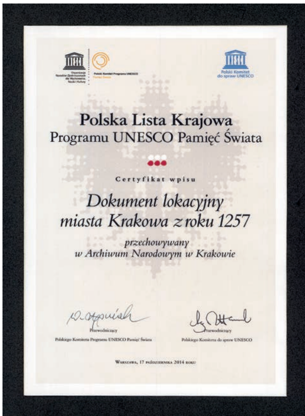
6. Certyfikat wpisu aktu lokacyjnego miasta Krakowa z roku 1257 na Polską Listę Krajową Programu UNESCO „Pamięć Świata” w 2014. ANK, Archiwum zakładowe, znak sprawy DN.071.2014