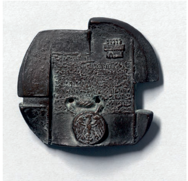
5. Medal upamiętniający jubileusz 100-lecia Wojewódzkiego Archiwum Państwowego w Krakowie, 1978 (awers i rewers). ANK, Miscellanea, sygn. 29/1604/41