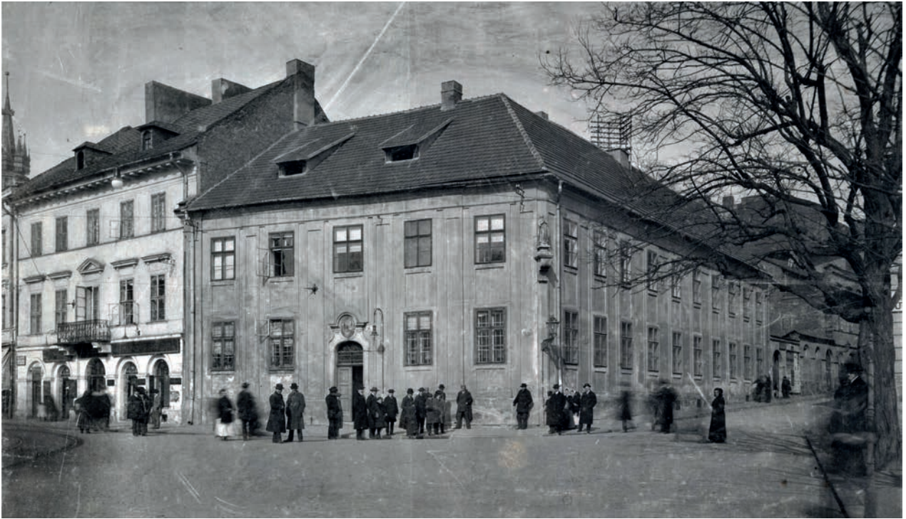
1. Siedziba Archiwum Aktów Dawnych Miasta Krakowa przy ul. Siennej 16, ok. 1910.

autorem wspaniałego ołtarza w kościele Mariackim był snycerz Wit Stwosz 3 . Doceniając znaczenie tego odkrycia, stwierdził w 1845 roku „zbytecznym byłoby powtarzać, jak jest ważną rzeczą nie dać ginąć szczątkom dawnych, po przodkach piśmienniczych pamiątek” 4 . Autonomia galicyjska umożliwiła środowisku krakowskich historyków działających w ramach Komisji Historycznej Towarzystwa Naukowego Krakowskiego (od 1872 r. Akademia Umiejętności) zwrócenie uwagi na konieczność zabezpieczenia staropolskich akt grodzkich i ziemskich oraz archiwaliów miasta Krakowa jako podstawy źródłowej badań naukowych nad dziejami Polski 5 . Wówczas dokumentacja ta, wykorzystywana wcześniej przez sądy i inne urzędy, także miejskie, traci-