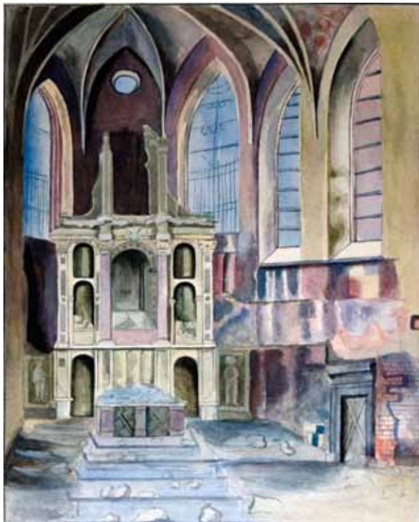
1. Ołtarz główny Caputy. Helena Flakowiczówna, kopia akwareli Bogumiła Gąsiorowskiego, Archiwum Prowincjalne Franciszkanów, zbiory graficzne

ne: Sancto Aurentii, Vincentii, Claudii, Eusichiani, Cstuli, Auriniani w r. 1678, drugie dwa relikwiarze Sanctorum ..... snycerską robotą i malarską sztuką złożone” 24 .