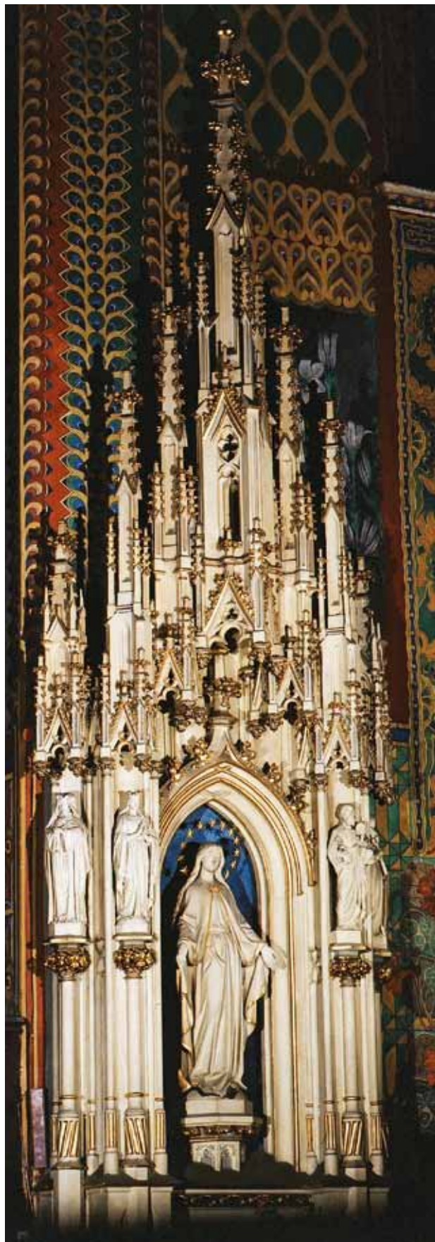
6. Ołtarz Matki Bożej Niepokalanej.

z fryzem z ostrołukowych arkadek z motywem trójlistnych maswerków. Partia cokołowa retabulum ma kształt poziomego prostokąta. W centrum jest ostrołukowa, przesklepiona wnęka o rozczłonkowanych krawędziach i archiwolcie, zwieńczona rodzajem szczytu – zredukowanej wimpergi o kształcie łuku wklęsło-wypukłego z żabkami i kwiatonem u wierzchołka. W niej na postumencie stoi figura Matki Bożej Niepokalanej. Przystawiona w sukni przewiązanej w pasie, i rozchylnym płaszczu spływającym po ramionach, w chuście na głowie. Ręce ma opuszczone i rozłożone, o odchylnych na zewnątrz dłoniach. Pod jej stopami glob ziemski z sierpem księżycy; bosą stopą depta węża. Głowę ma lekko przechyloną na lewe ramię, otoczoną kolistym nimbem z dwunastoma gwiazdami.