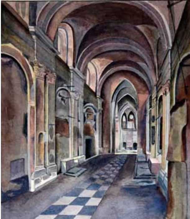
3. Kościół Franciszkanów po pożarze 1850 roku. Helena Flakowiczówna, kopia akwarelii Bogumiła Gąsiorowskiego (BJ Zbiory Graficzne nr i. IR548 t.9 III); Archiwum Prowincjalne Franciszkanów, zbiory graficzne

„odmurowano i wypełniono maswerkami gotyckie okna, zlikwidowano ślepą kopułę i zrekonstruowano sklepienie gotyckie w pręśle krzyżowym” 126 . W nawie głównej zaś usunięto kompozytowe kapitele pilastrów, a powstałe w ten sposób lizeny omurowano ciężkimi ośmiobocznymi filarami z gotycyzującymi głowicami. Beczkowemu sklepieniu dodano krzyżowe żebra. Okna ujęto w romanizujące kolumnienki 127 .