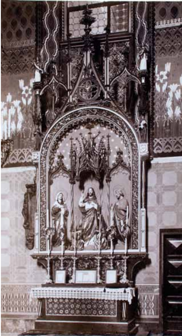
11. Ołtarz Serca PJ wg pomysłu W. Ekielskiego.

na odprawianie mszy versus populum , podczas gdy ołtarze boczne – w niewielkiej liczbie – powinny być umieszczone w kaplicach lub mniej widocznych miejscach 202 .