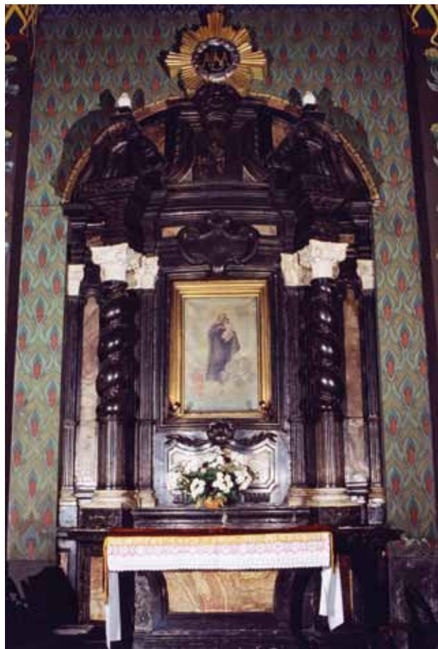
9. Ołtarz św. Jana Pawła II. Archiwum Prowincjalne Franciszkanów, zbiory graficzne

Jest to ołtarz przyścienny, w zamknięciu wnęki arkadowej, jednoosiowy, jednokondygnacyjny, ze zwieńczeniem. Ma mensę o kształcie sarkofagowym. Nastawa skomponowana została dwuplanowo. Jej środkowa partia ma wypukłą formę, ujętą parą kompozytowych kolumn ustawionych na ukośnych cokółkach, równych wysokości mensy. Stoją one na tle obustronnie zdwojonych pilastrów kompozytowych, do których po stronie zewnętrznej przylegają wydłużona płycina i półpilastr. Trzony pilastrów zdobione żłobkowaniem. Trzony kolumn zróżnicowane, w dolnej części żłobkowane, w górnej kręcone, oplecione liściastą girlandą. W zamknięciu retabulum pełne belkowanie przełamane uskokowo nad kolumnami. Powyżej półeliptyczny, rozerwany przyczółek z wolutowymi odcinkami bogato profilowanego gzymsu w osiach kolumn, ze zwieńczeniem ujętym wolutami podtrzymującymi spiętrzony, profilowany gzyms z półkoliście zamkniętym uskokiem, w którym znajduje się muszla. U szczytu promienista gloria z monogramem św. Anny w otoku z obłoków. Na gzymsach rozerwanego przyczółka płomieniste wazy.