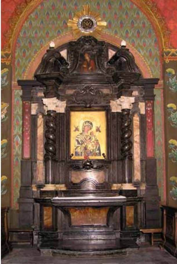
10. Ołtarz M.B. Nieustającej Pomocy.

niach spirali, w jednej trzeciej części wysokości profilowanych, na tle wiązek kanelowanych (żłobkowanych) pilastrów dźwigających regularne belkowanie. Profilowane łuki przerwane przyczółka z wygiętą linią zakończone są wolutami. Na nich umieszczono wazony z promieniami. W zwieńczeniu pośrodku przerwane tympanonu, nasadnik z obrazem św. Kazimierza na blasze. W szczycie monogram patronki ołtarza wpisany w koło obłoków, z których emanują promienie w kształcie krzyża. Nad prostokątnym profilowanym retabulum horyzontalny kartusz. Poniżej w predelli dekoracja na wzór kartusza ujętego w ramki z wypełnioną różowym marmurem podłużną płyciną. Głowice kolumn i pilastrów kompozytowe, precyzyjnie wykute z białego kamienia. Bazy, płaszczyzny cokołów i pasy między bocznymi pilastrami wraz z płaszczyzną antepedium są wykonane z różowego i szarego marmuru 180 .