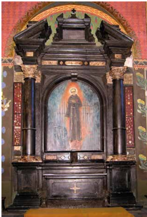
8. Ołtarz św. Maksymiliana.

Jest to wczesnobarokowy ołtarz, wykonany z czarnego marmuru w Dębniku w 1636 roku. Pier-