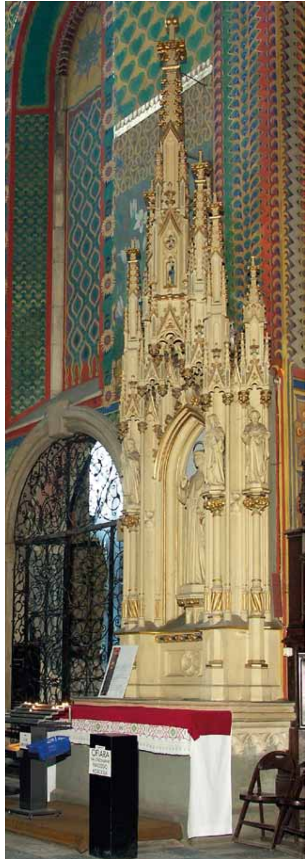
7. Ołtarz św. Antoniego. Archiwum Prowincjalne Franciszkanów, zbiory graficzne