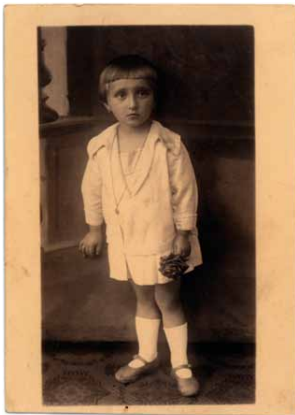
12. Portret dziewczynki. Fot. Atelier „Erna” przy ulicy Lubicz 2, 1. połowa lat dwudziestych XX w., własność autorki

Inny charakter mają fotografie wykonywane w Rabce. Spuścizna po atelier Ettingerów z uzdrowiska obejmuje przede wszystkim zdjęcia wykonane w plenerze, tak zwane „zdjęcia uliczne”. Ettingerowie prawdopodobnie zatrudniali fotografów, którzy pracowali dla nich na wolnym powietrzu. Osoba działająca w terenie wykonywała przechodniom zdjęcie, po czym wręczała firmowy bloczek z odpowiednim numerem, który upoważniał do odbioru gotowego zdjęcia w zakładzie. Bloczki takie zawierały nazwę i adres zakładu wraz z informacją: „Przed chwilą dokonane zdjęcie Nr... może W.P. odebrać już jutro” 70 . Ponadto zawierały informację o możliwości wysłania fotografii pocztą. Zdjęcia z Rabki to typowe pamiątkowe ujęcia z rodzinnych urlopów, wykonywane bez względu na porę roku (il. 19, 20). Te z zakładu Ernesty i Dawida sygnowano na awersie owalną sygnaturą z informacjami: „Foto Centrala Janina”, nazwą miejscowości i rokiem wykonania zdjęcia lub okrągłą sygnaturą