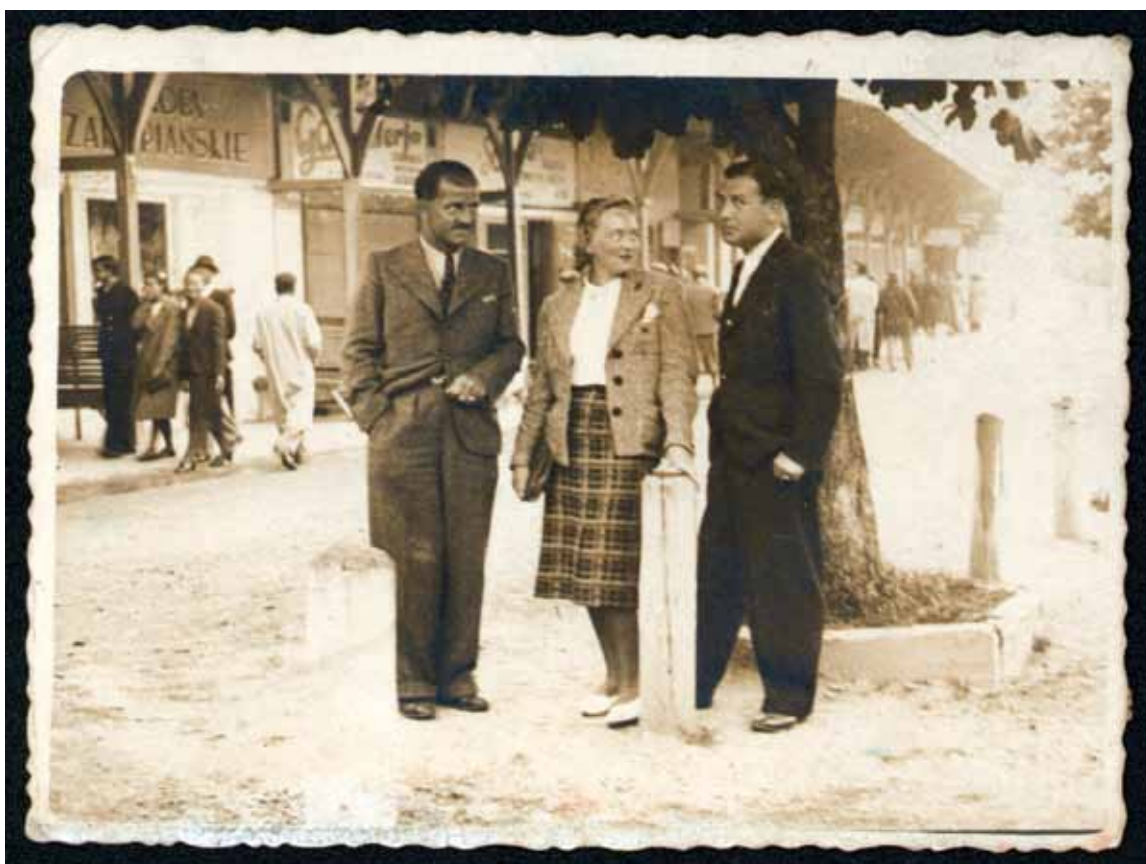
20. Grupa osób przed Bazarami w Rabce. Fot. „Foto-Film Janina” w Rabce-Zdroju Berty i Filipa Ettingerów, 2 VII 1939, własność autorki