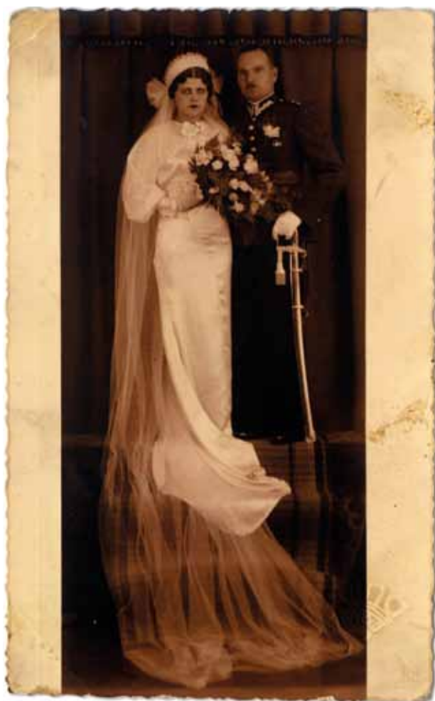
17. Portret ślubny. Fot. Atelier „Janina” przy ulicy Starowiślnej 21, ok. 1937–1939, własność autorki

Oskar i Izydor Ettingerowie zostali u progu wojny zmobilizowani do Wojska Polskiego, co umożliwiło im przeżycie. Izydor służył w Królewskich Siłach Powietrznych (RAF) w dywizjonie 307 jako radiomechanik, prawdopodobnie od 1940 roku 83 . Oskar został przydzielony do 2 Pułku Strzelców Podhalańskich, końca wojny doczekał w Rosji Sowieckiej.