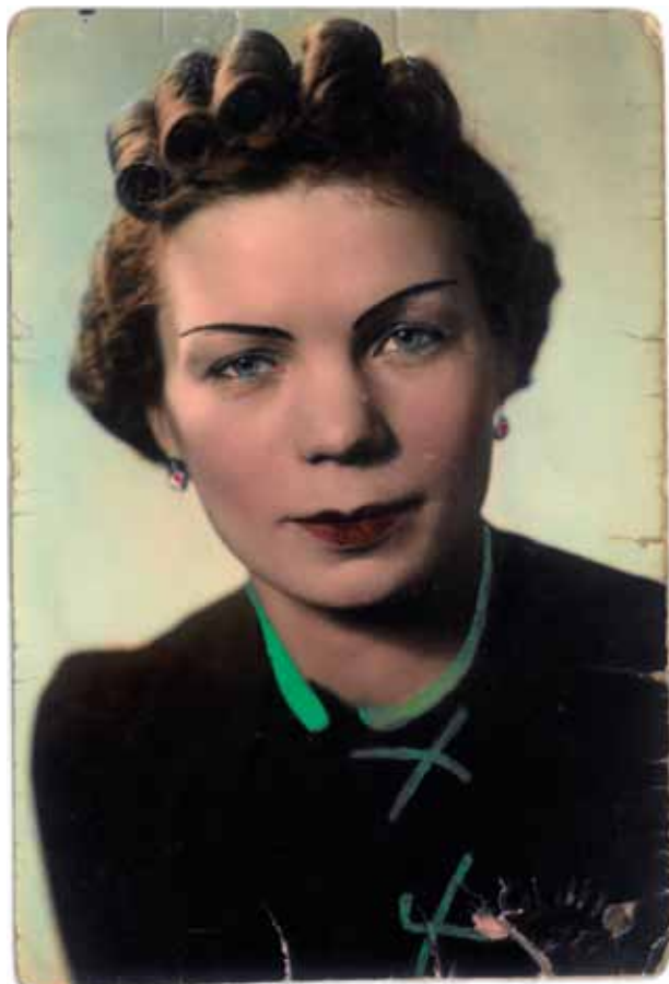
15. Portret kobiety podkolorowany.