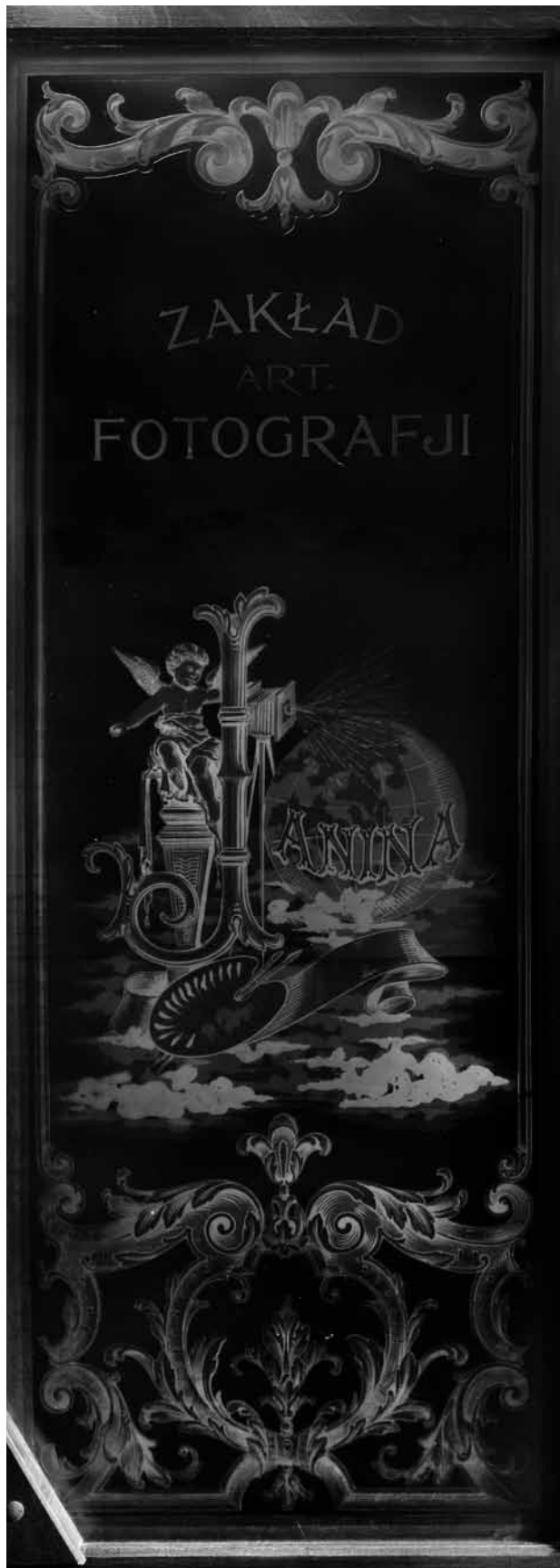
8. Szyba z głównych drzwi wejściowych do atelier „Janina”, obecnie część wystroju kawiarni przy ulicy Starowiślniej 21.

kład funkcjonował do 1943 roku, jego wojenne losy przedstawiono poniżej, w części dotyczącej historii z czasów okupacji.