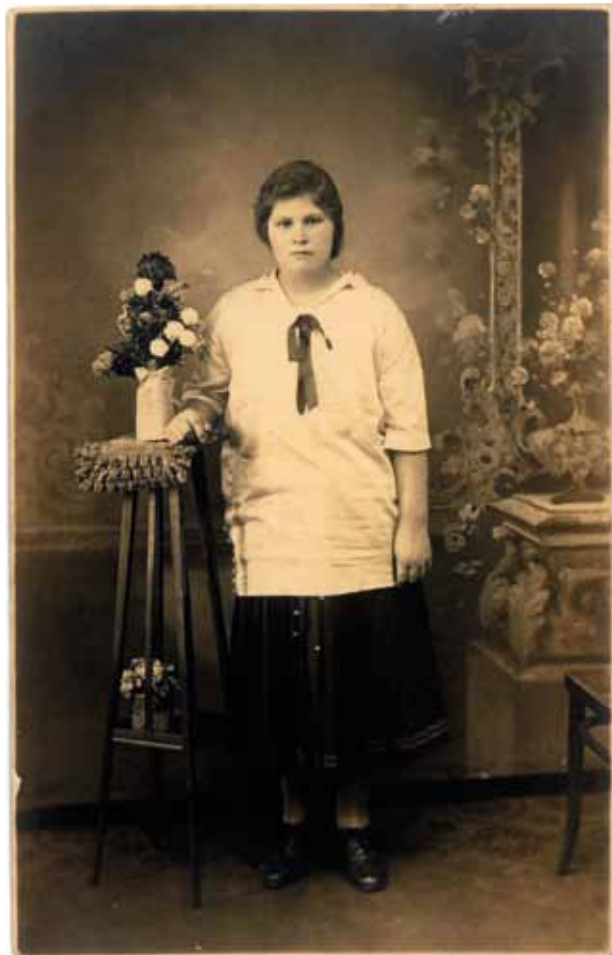
13. Portret kobiety. Fot. Atelier „Erna” przy tak zwanym placu Wielopole, IX 1925, własność autorki

z nazwą „Janina” i nazwą miejscowości. Ich rodzeństwo stosowało również owalną sygnaturę, która zawierała nazwę miejscowości i rok, a na odwrocie fotografii najczęściej odbijano pieczętkę: „Foto Film Janina Rabka Zdrój”. Część zdjęć, zwłaszcza małego formatu ok. 6,5 \times 8,5 cm, sygnowano tylko na odwrocie. Ettingerowie wykonywali także zdjęcia lokalnych willi i sanatoriów czy widoki uzdrowiska, które reprodukowano na kartach pocztowych. Część fotografii wykonywano aparatami à la minute lub małoobrazkowymi Leicami, będącymi najmniejszymi i najlżejszymi aparatami uniwersalnymi 71 . Biorąc pod uwagę panujący w uzdrowisku ruch turystyczny, długotrwałą działalność połączoną z szeroką ofertą usług, Ettingerowie musieli osiągać z wykonywanej działalności duże dochody. Dowodzi tego fakt inwestowania w nieruchomości w Krakowie. Rodzina fotografów była współwłaścicielem dwóch nowych