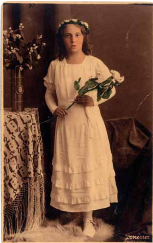
14. Portret komunijny, podkolorowany.