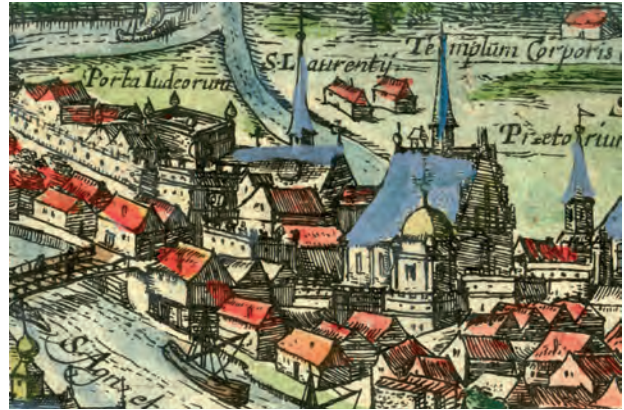
5. Kościół św. Wawrzyńca (pierwszy od lewej) oraz kościół Bożego Ciała (drugi od lewej) w Kazimierzu, fragment miedziorytu nieznanego autora wykonanego na podstawie rysunku z lat ok. 1603–1605 roku zamieszczonego w publikacji Civitates Orbis Terrarum, t. 6, Kolonia 1617, tabl. 43.