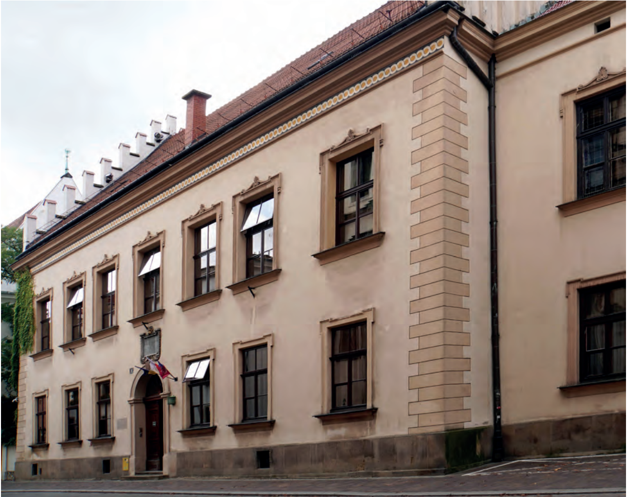
1. Fasada Collegium Nowodworskiego.