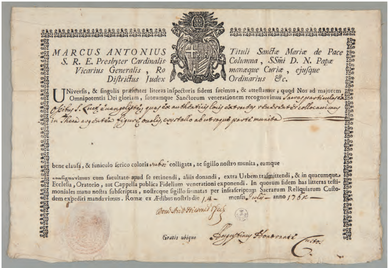
3. Kard. Marcus Antonius Colonna, Poświadczenie autentyczności relikwii św. Łukasza Ewangelisty, 14 VII 1782, pieczę., k. 2., w zbiorach Muzeum Narodowego w Krakowie, nr inw. MNK VIII-rkps.1133/3.