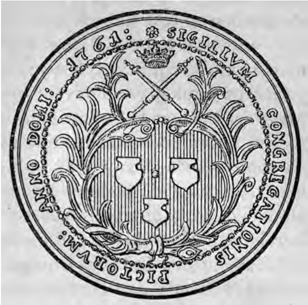
2. Odrys odcisku pieczęci cechu malarzy i pozłotników. Fot. za Leonard Lepszy, Cech malarski w Polsce. Przyczynek do historii sztuki , „Wiadomości Numizmatyczno-Archeologiczne”, 1895, nr 2–3, t. 2, kol. 314

sując w księdze rachunkowej 7 złotych i 6 groszy wydane na ten cel pod datą 9 stycznia 41 .