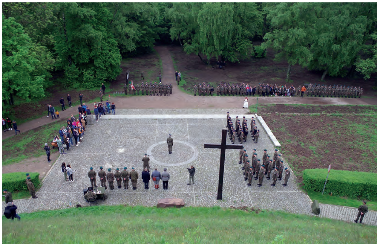
3. Pierwszy po drugiej wojnie światowej Ogólnopolski Zjazd Orląt 21 maja 2023 roku – uroczystości pod kopcem Piłsudskiego.