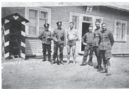
Punkt celny (Zollamt) na drodze ze Spytkowic do Ryczowa w czasie okupacji niemieckiej. Niemiecka straż graniczna, 1943 r.