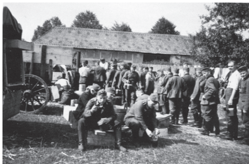
Żołnierze Wehrmachtu przy plebanii w Spytkowicach, 14.09.1939 r.