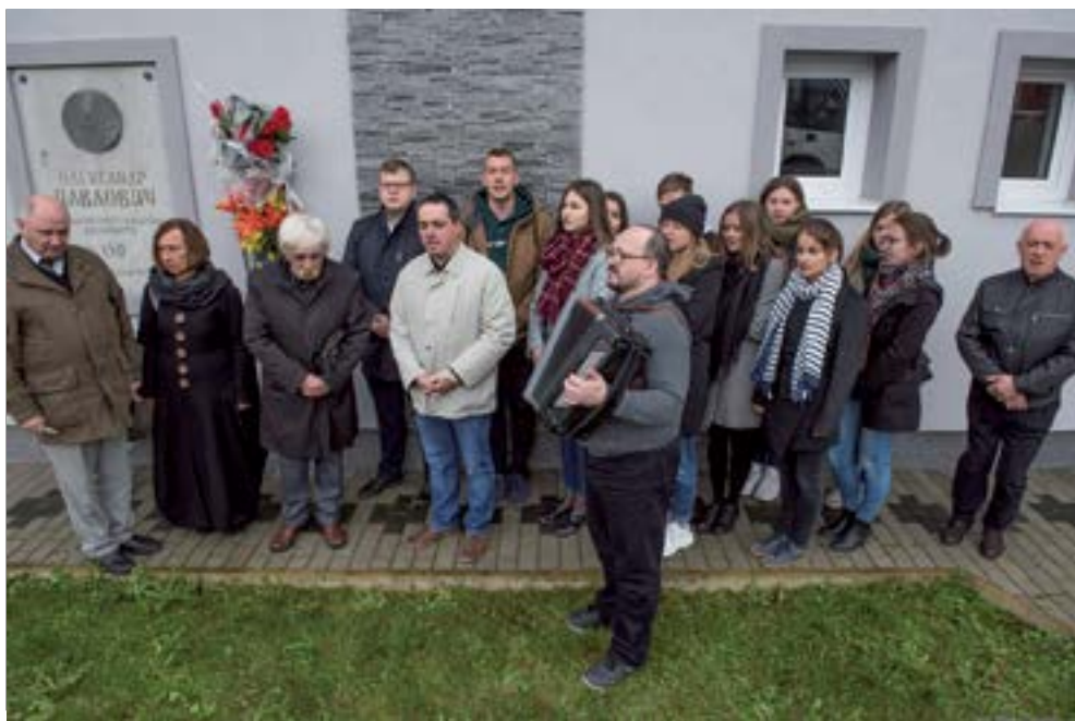
12. В місци народжыня Будителя - Шарішскым Чорным