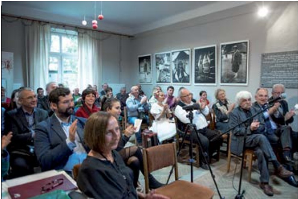
4. Публика з радістю позерат на малых співаків