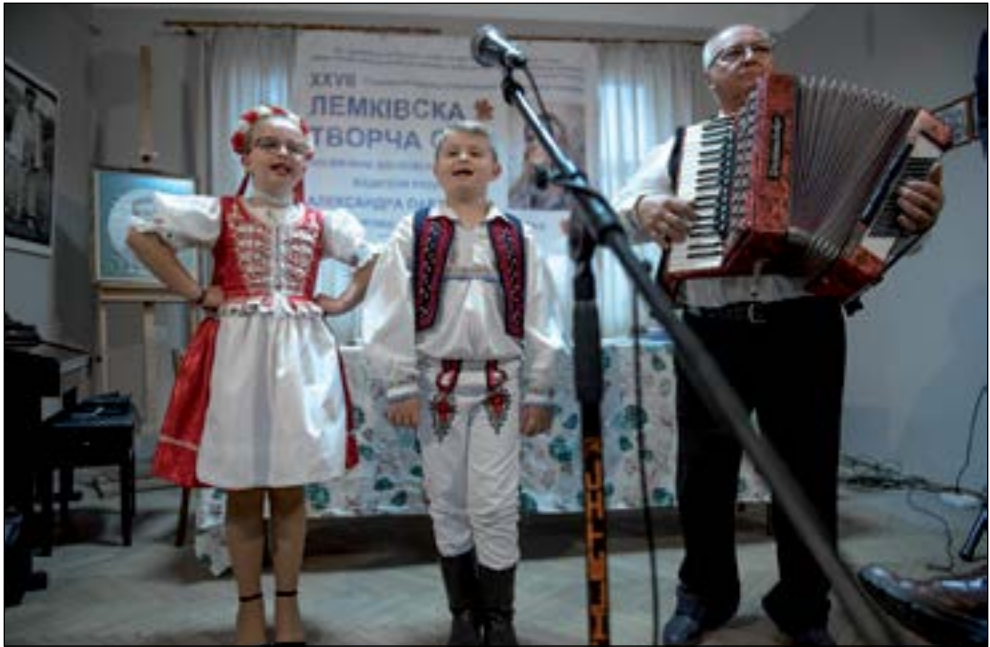
5. Русиньскы співакы то професіоналісты од малого