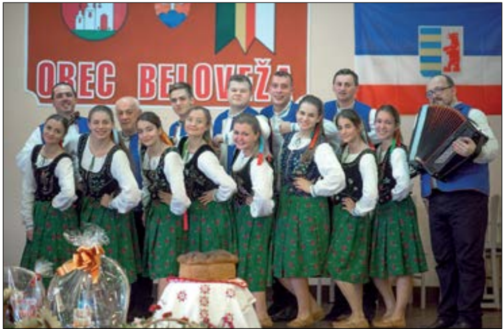
15. Біловежа долго буде споминала Терочку а Терочка Біловежу