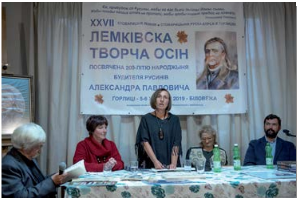
8. Поезія буває зворушненьом