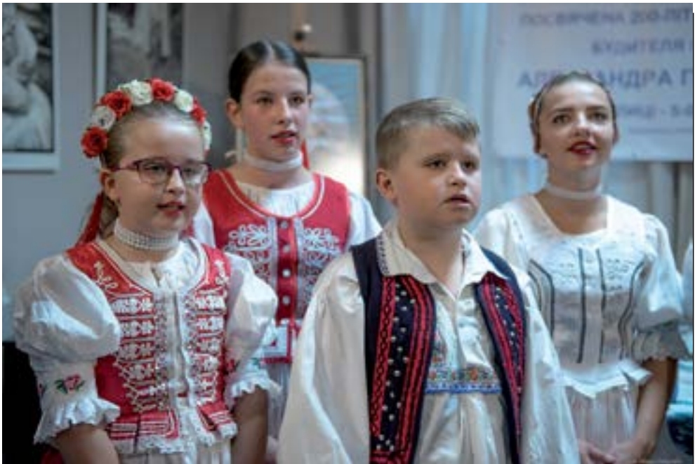
6. Яка краса приїхала на Осін з Біловежы