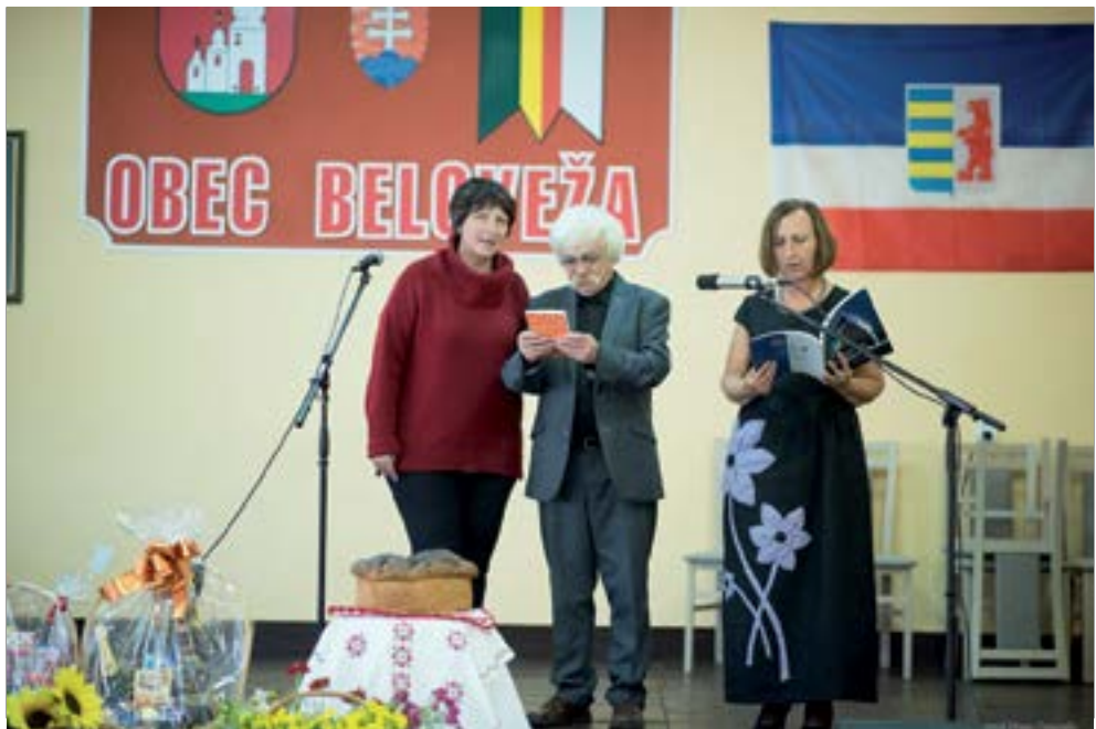
16. Творці і в Біловежы мали свій презентацыйный час