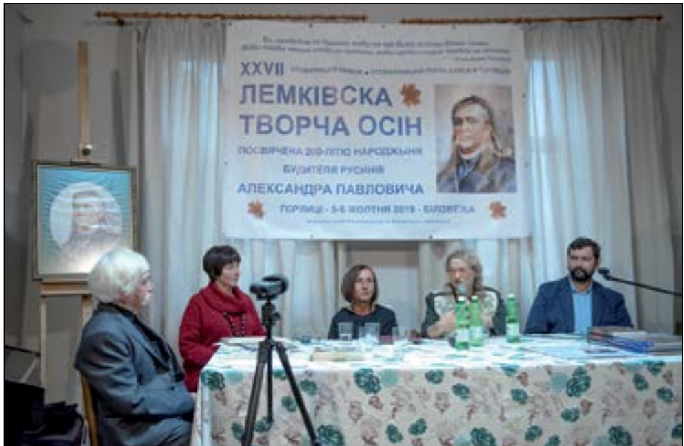
7. Презентація творців то суть Осени