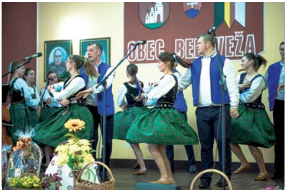
14. Але ся розгулялі старшы Тарочки