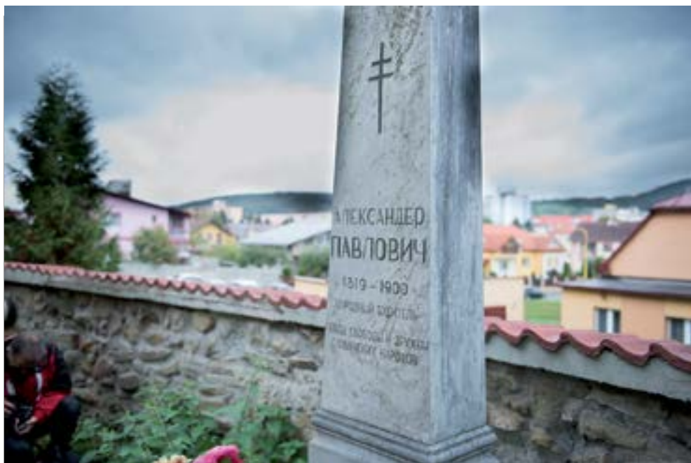
10. Нагробный монумент Будителя