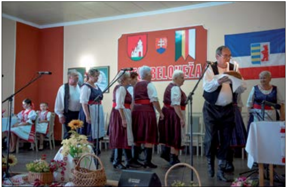
13. Ансамбль Біловежанка праздуе свое 15-ліття