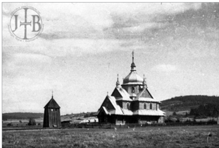
7. Gładyszów, cerkiew, ok. 1960 r.