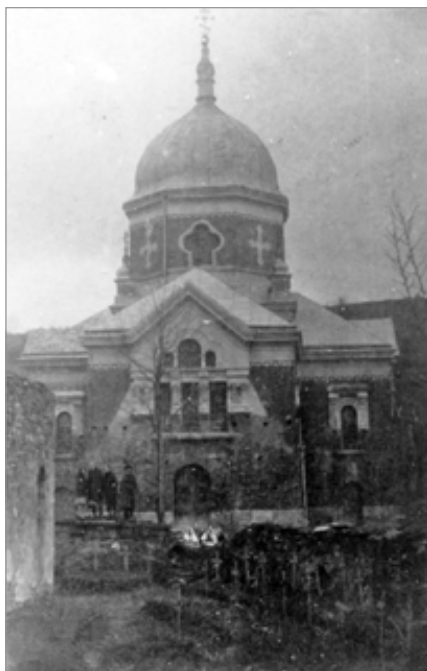
2. Polany, cerkiew w okresie międzywojennym