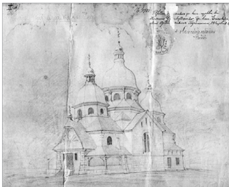
6. Żegiestów, projekt cerkwi, 1917 r., zb. Archiwum Parafialnego w Żegiestowie