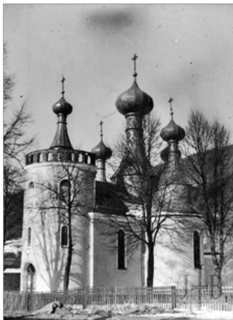
4. Klimkówka, cerkiew, 1961 r.