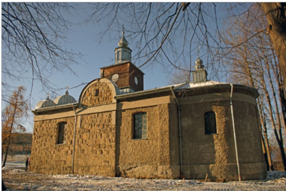
11. Rozdziele, cerkiew, fot. D. Nowak, 2018 r.

Osobne zagadnienie stanowi architektura cerkwi prawosławnych wznoszonych na Łemkowynie w latach 20. i 30. XX w., jednak wykracza ono poza ramy niniejszego artykułu i wymaga indywidualnego opracowania.