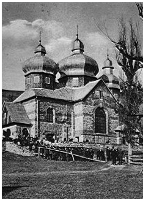
5. Żegiestów, cerkiew na międzywojennej pocztcówce

Drugą analizowaną grupę stanowią cerkwie odbudowane w miejscach zniszczonych podczas działań wojennych w latach 1914-1915. Większości cerkwi znajdujących się w pobliżu frontu, nawet jeżeli zostały uszkodzone wyniki ostrzału, udało się przetrwać. Jednak cztery z nich,