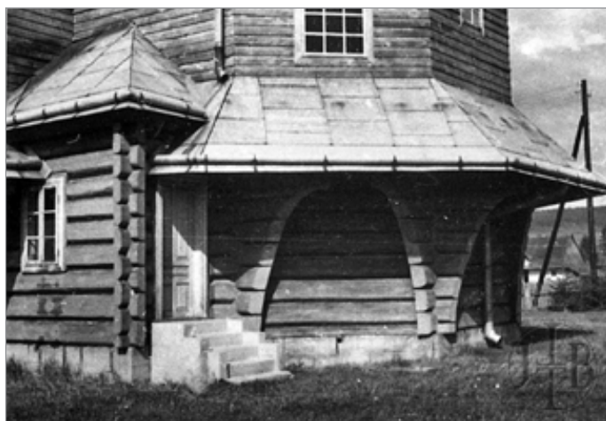
8. Gładyszów, cerkiew, fot. J. Tur, ok. 1960 r. zb. Ruskiej Bursy

20. i 30. Fartuch przyjechał do Lwowa, gdzie współorganizował wspomnianą wyżej kooperatywę. Po II wojnie światowej pracował jako architekt w czeskich Cieplicach, a następnie we Lwowie (Філевич 2000, 24-25).