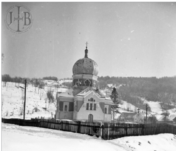
3. Polany, cerkiew po odbudowie ze zniszczeń wojennych, fot. J. Tur, ok. 1985 r. zb. Ruskiej Bursy