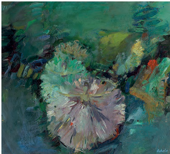
Балет , 1969, олій на полотні, Крайска галерія в Пряшові