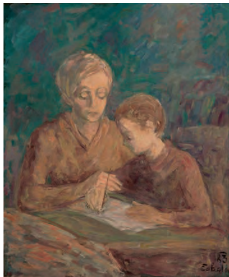
Приправа до школы, 1983, олій, Выходословацька галерія в Кошціях