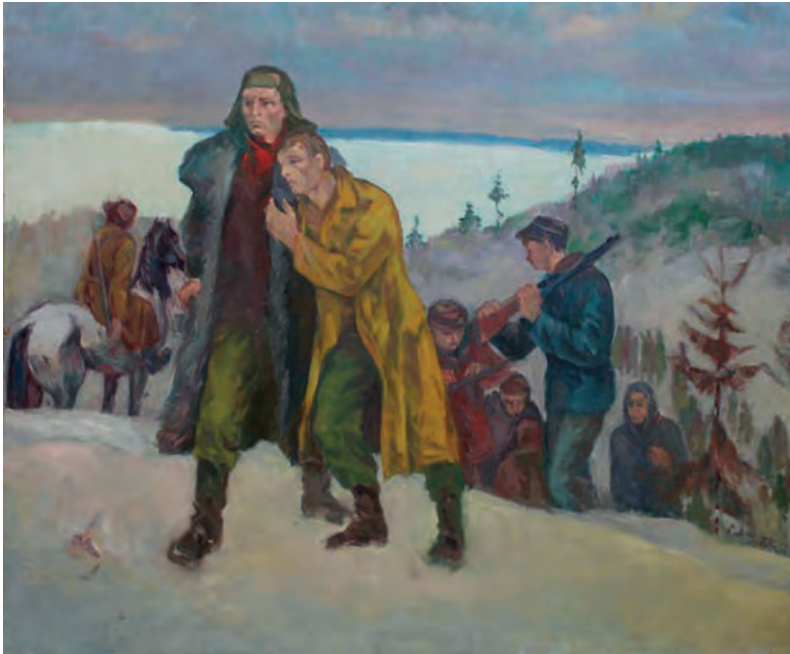
Партізане , около р. 1970, олій, Вігорлатський музей в Гуменнім

У великій мірі хосновав ясны формы выскладаны до точно вымеженого простору композиціі. Важнов ся стае лінія, яка му служить на выдільня обектів і їх поставліня на полотні. Образова плоха в тых композиціях ся стае дінамічнішов. Чабалови суть блізшы фігуралны композиціі, в котрых ся концентруе на інтімні похопленый жанер.