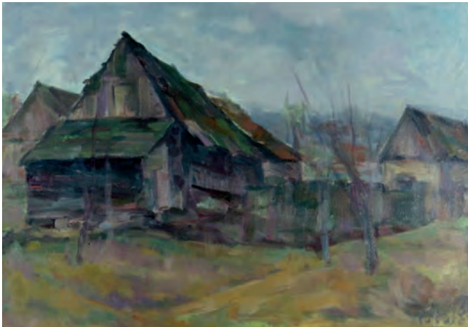
3 Чабин, 1989, олій, сукромна збірка

Шарішска країна Михала Чабалы є рівнак ідентічна як ей автор. Чабала виходив з оригінального зажитку захопленого змыслами з цілём порозуміти скуточности природного простору і чутливо передати ёго пах ці есенцію якнайщіріше.