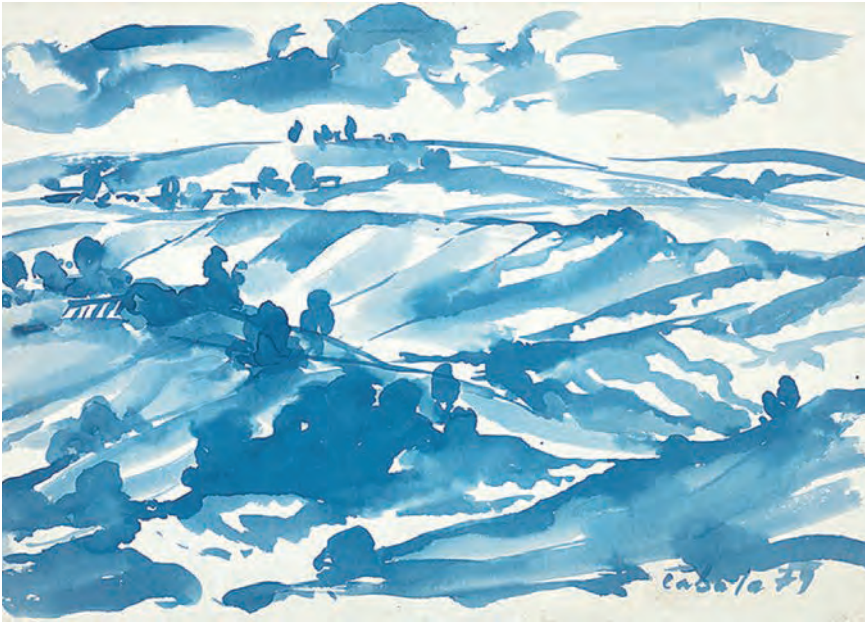
Выходсловацька країна, 1979, акварел, Крайска галерія в Пряшові

Техніка акварелу у Чабалы є дінамічна – дінамічны тягы пензля, но емны, лірічны. На розділ од оліємалеб, схоснована техніка акварела, хоць є дінамічна, но шыроky тягы пензля малюють звонену країну без збыточных деталів. Країна чіста, інтімна, без участи чоловіка.