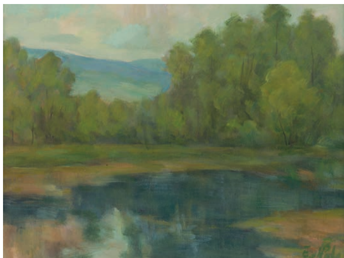
Шарїшска країна , 1995, олїй, Крайска галерія в Пряшові

Найвекша часть Чабаловой вытварной особности належала країномальбі. Чабала надвязав на тоты пруды богатой традиції выходословацькой країномальбы, котрій ішло о захоплїня цілой шырькы налад і характерістичных тіповых знаків выходословацькой країны – країны, што іншпірує дінаміков природных перемін, монументалностёв і епічностёв своіх панорам.